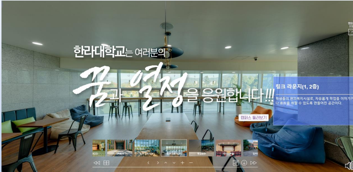
북 카페 등 소통 공간