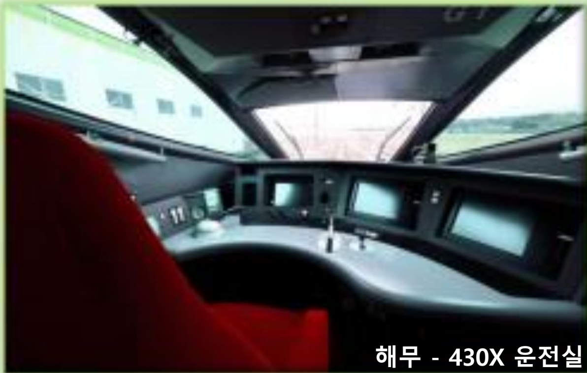
해무 - 430X 운전실