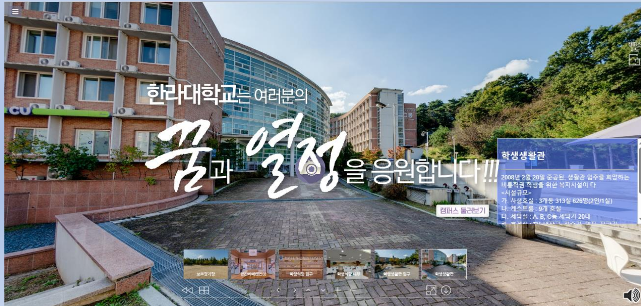
신입생 전원 기숙사 제공